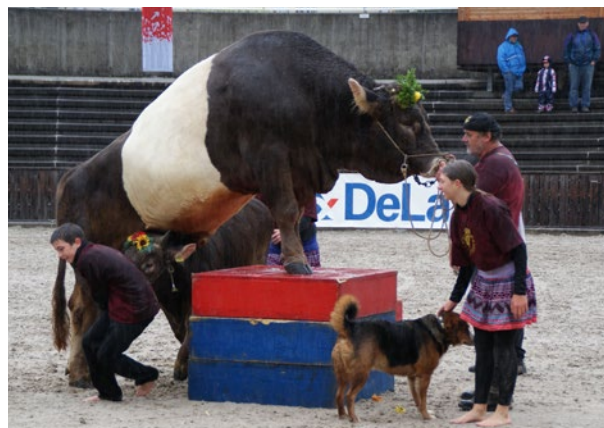
Démonstration du cirque paysan Maute à l'OLMA 2013

Le cirque paysan Maute montre qu'un taureau peut avoir une grande confiance en la personne qui s'occupe de lui. Mais cela ne signifie pas que cela soit possible avec tous les taureaux. Cela dépend du caractère de l'animal et de son imprégnation pendant sa jeunesse. Le taureau doit à la fois respecter son maître et lui faire confiance.