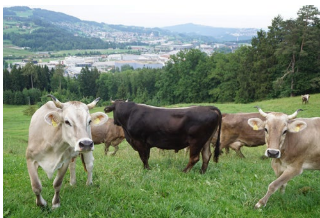
Le taureau dans le pâturage fait régner le calme dans le troupeau..

Les éleveurs qui ne veulent pas faire saillir toutes leurs vaches par le même taureau peuvent le garder avec les vaches tarées ou les bovins et ensuite le mettre avec les autres vaches pour l'accoupler avec l'une d'entre elles. C'est ce que pratique Werk- und Wohnheim à Mettmenstetten. Mais cela a un impact sur la régularité des sorties et la structure du troupeau et doit être réservé à des taureaux respectueux.