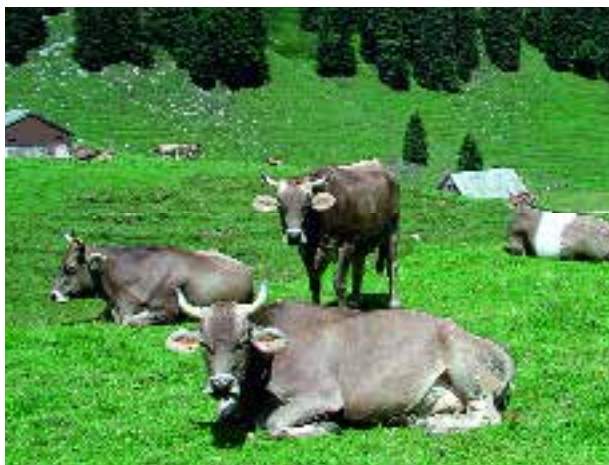
La vache est un animal de prairie. Entre les périodes de pâture, elle se couche et rumine.