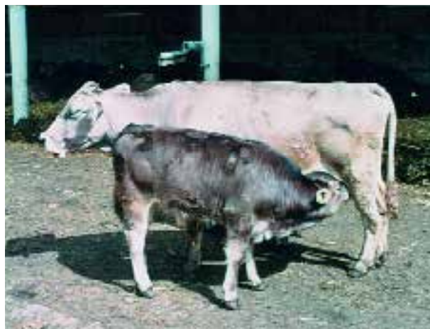
Il y a moins de troubles du comportement chez les veaux qui peuvent téter leur mère.

Dans la nature, une vache portante près de son terme s'isole du troupeau un ou deux jours avant la mise bas et recherche un endroit approprié quelque peu éloigné du troupeau. Lorsque le veau est né, sa mère le lèche. Celui-ci tète sa mère déjà dans les premières heures après sa naissance. Il s'établit une étroite relation entre la mère et le veau.