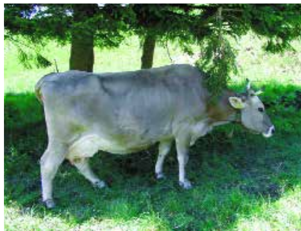
Un pâturage devrait disposer de places d'ombre.

Les vaches supportent relativement bien le froid, à la condition qu'elles soient en bonne santé, qu'elles soient habituées au froid et qu'elles soient bien nourries. C'est seulement à partir d'une température de -15^{\circ}\text{C} qu'elles ont besoin d'une énergie complémentaire. Elles se sentent à l'aise aussi longtemps qu'elles disposent d'un abri contre les courants d'air, d'une couche sèche avec une bonne litière. Par contre, des températures supérieures à 25^{\circ}\text{C} engendrent rapidement un stress de chaleur, principalement chez les vaches qui ont une haute production laitière. La production laitière provoque une hausse de la température du corps. En été, les vaches et les génisses ont besoin de places ombrées sur les pâturages ou doivent être, en cas de grosse chaleur, rentrées à l'étable. Dans les étables exposées à la température extérieure, les toits doivent être isolés contre les rayons du soleil.