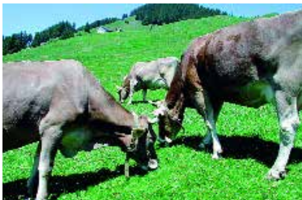
Les vaches s'arrangent bien entre elles à la condition que la vache de rang inférieur cède la place à celle d'un rang supérieur.

ou de tête et – si la vache d'un rang inférieur ne s'écarte pas suffisamment rapidement – aussi des coups dans le ventre ou dans la tétine, ce qui n'arrive pas souvent dans une pâture. C'est pourquoi beaucoup d'agriculteurs écornent les vaches déjà comme veaux. Lorsqu'une stabulation libre est bien conçue, on peut se dispenser de procéder à l'écornage, ainsi que le prouve la pratique. Il faut surtout éviter les impasses et les couloirs étroits. Le problème des confrontations se pose moins dans les étables à l'attache. En effet, le fait d'attacher les vaches empêche le comportement social naturel de ces animaux de troupeau.