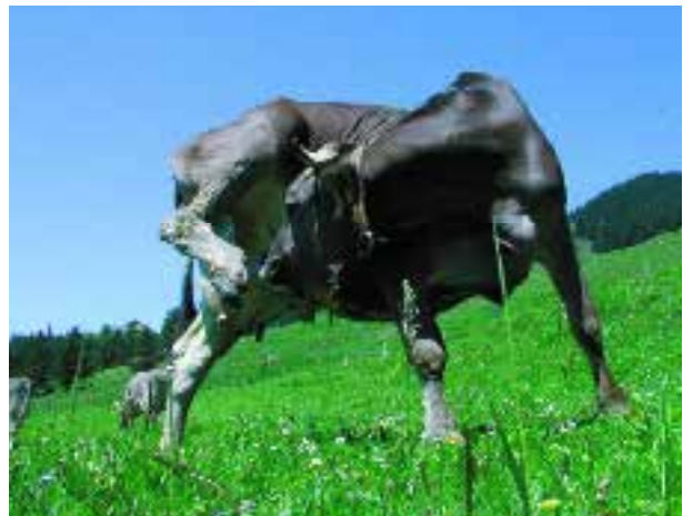
Lorsque la vache veut se lécher à l'arrière, elle doit fortement tourner la tête et ne se tient que sur trois jambes. Il lui faut alors un sol antidérapant.

Un bon contact entre les humains et les animaux facilite les relations avec les animaux.