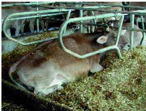
Un matelas de paille bien entretenu garantit une couche propre et tendre.