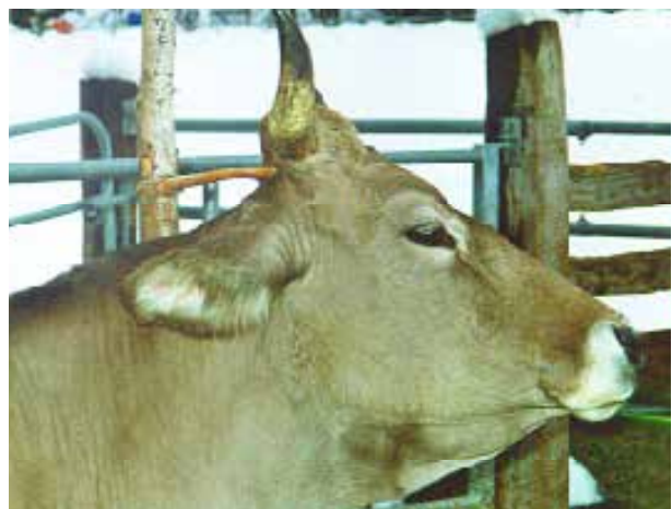
La langue de la vache n'atteint pas toutes les parties du corps.